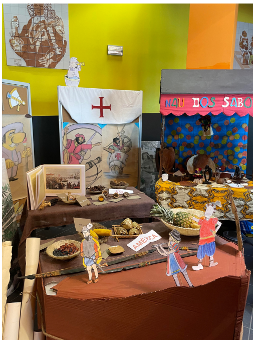
Descobre as especiarias.