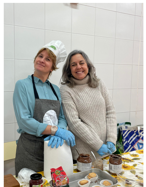
Línguas e gastronomia de mãos dadas.

No dia do Agrupamento, os professores realizaram com os seus alunos diversas atividades: mostras gastronómicas, exposições, experiências, música e dança.