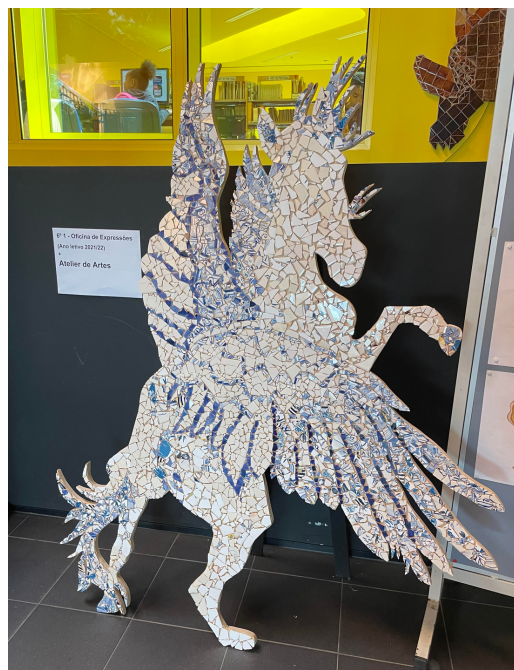
Arte na escola.