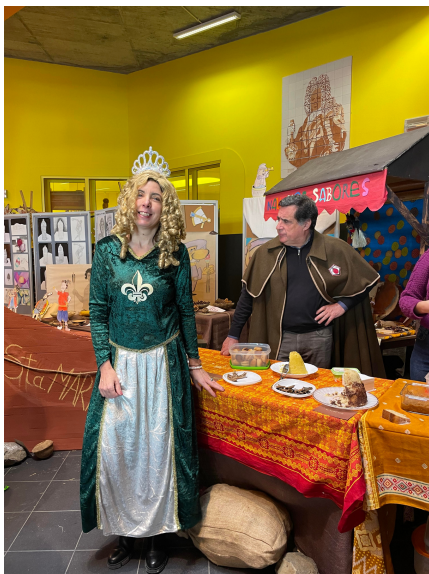
Banca de História